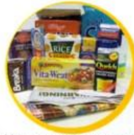
Newspapers, magazines cardboard boxes, phone books, junk mail, office paper, old letters and egg cartons

• Ons kan energie bespaar deur goed te herbenut en te herwin