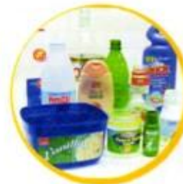
Rinsed soft drink bottles plastic bottles marked 1, 2, or R (no lids please)