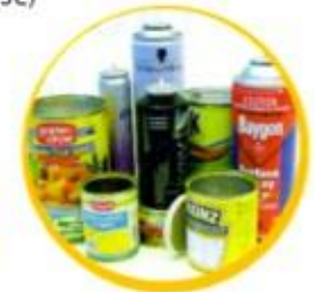
Steel and aluminium cans, foil and empty aerosols