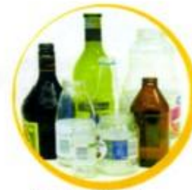
All glass bottles and jars. Rinse and place in bin. (No lids please)