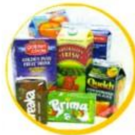
Juice and milk cartons